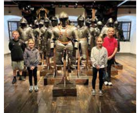
Die Kinder der 4. Stufe besuchten das Zeughaus

Nach dem Mittagessen standen noch die Burg, der Dom, das Mausoleum und der Glockenspielplatz am Plan. Ein wenig erschöpft ging es dann am späten Nachmittag wieder mit dem Bus Richtung Heimat zurück.