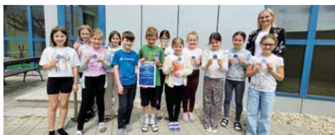
Der Schulchor mit dem Meistersinger-Gütesiegel 2026