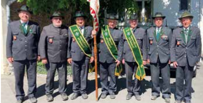
Die 7 Teilnehmer des ÖKB OV Kaindorf an der Jubiläumsfeier in Bernstein