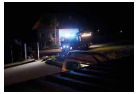
Küchenbrände in Hartl und Kopfing konnten durch schnelles Eingreifen rasch gelöscht werden