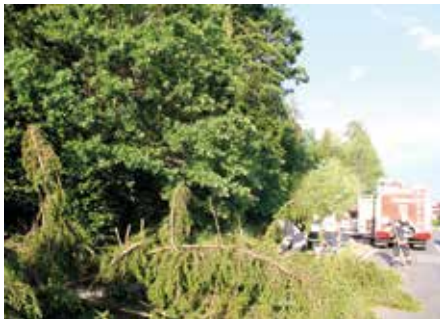
Erste Unwettereinsätze: Baum über Straße L 412 und Trafo-Brand nach Blitzschlag in Großbach