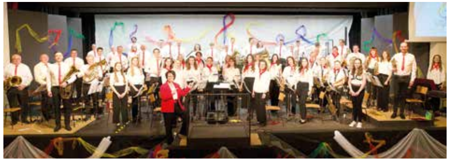
Frühjahrskonzert unter dem Motto „Colours of Music“