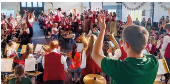
Beste Stimmung beim Musifest in Tiefenbach