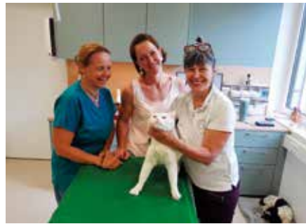
Danke an das Team der Tierarztpraxis in Kaindorf für die kostenlose Behandlung