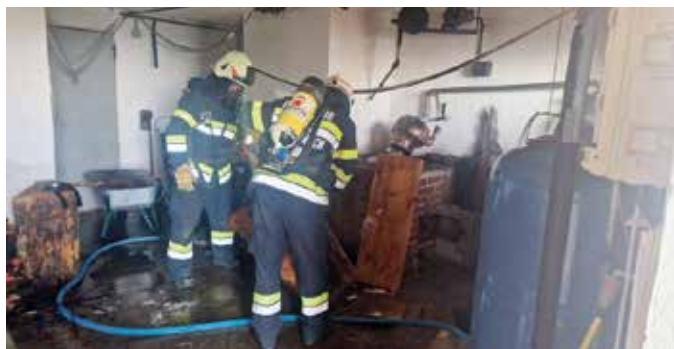
Kesselexplosion in Vockenbergl