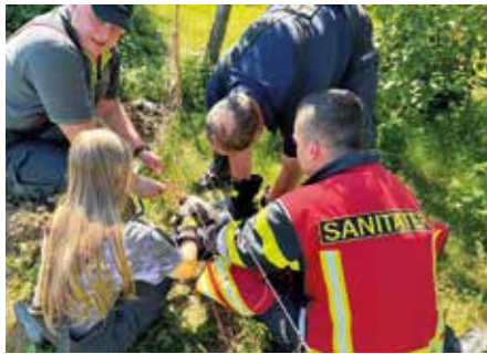
Retten eines strangulierten Katers in Kopfing