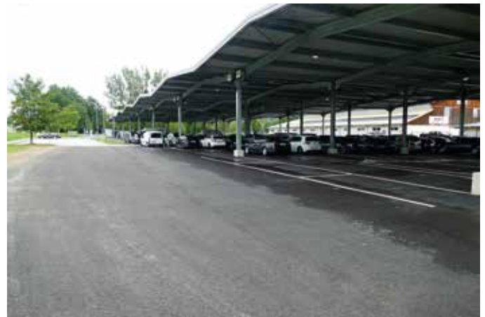
Der Park & Ride Parkplatz ist nun zur Gänze asphaltiert und die Parkplätze wurden neu markiert.