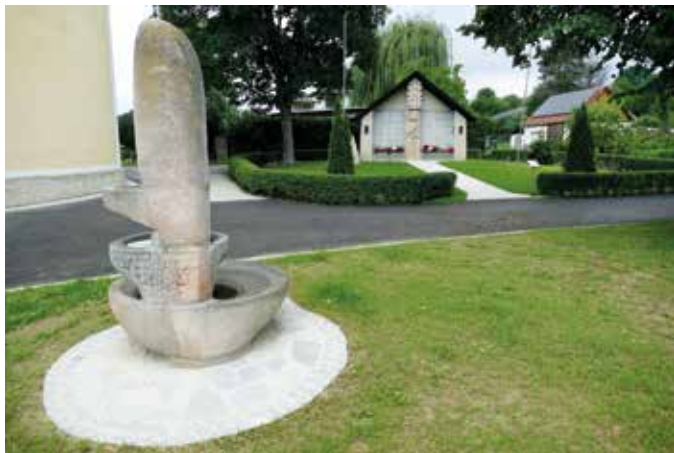
Der Platz beim Kriegerdenkmal mit dem Erzherzog-Johann-Brunnen wurde neu gestaltet.