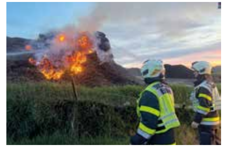
Schreddermaterial in Brand auf einer Kompostieranlage in Kopfing