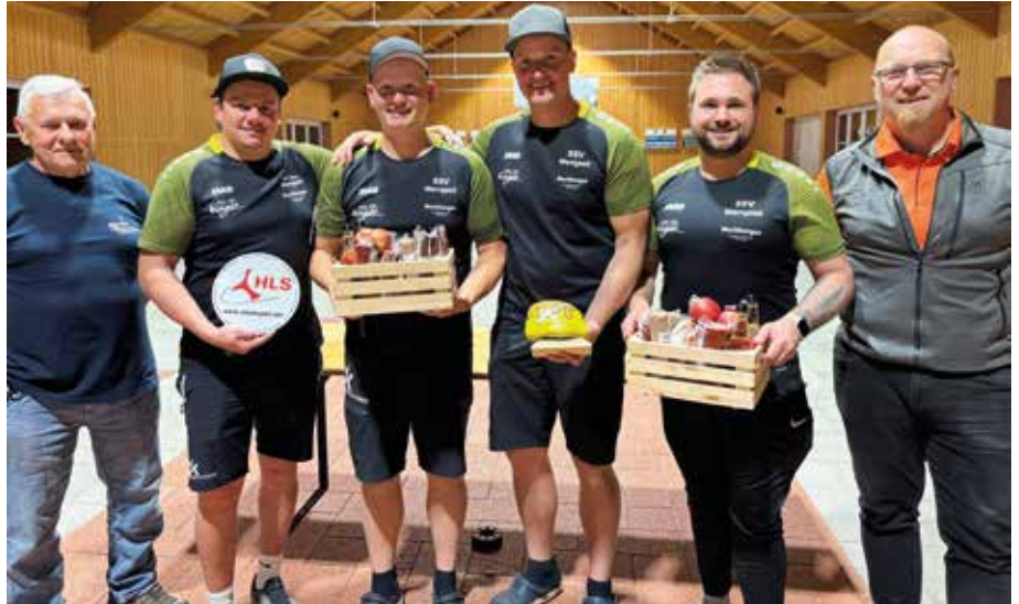
Der ESV Wenigzell gewann das Bochbummelturnier 2026

Mit dem Finale fand das 18. Bochbummelturnier des ESV Hofkirchen einen würdigen Abschluss. Nach drei spannenden Vorrunden trafen die besten Teams aufeinander und sorgten für hochklassigen Stocksport. Den Turniersieg sicherte sich Wenigzell mit einer beeindruckenden Leistung. Die Mannschaft blieb im Finale ungeschlagen, gewann alle sechs Spiele und holte sich mit 12:0 Punkten souverän den Titel. Auf den Plätzen folgten Ratten (Titelverteidiger) mit 8:4 Punkten und Zeil-Stubenberg mit 6:6 Punkten. Auch die weiteren Finalteilnehmer Schachen-Rosenberg, Großhart, Greith und Wagenbach zeigten starke Leistungen und sorgten für spannende Begegnungen bis zum letzten Durchgang. Als Veranstalter freuen wir uns über einen gelungenen Turnierverlauf, faire Wettkämpfe und zahl-