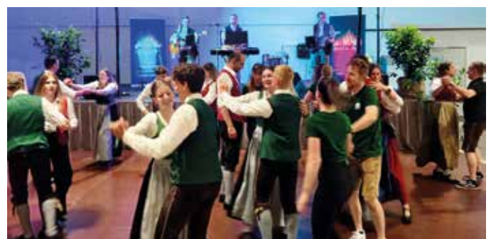
Tanzmusik mit Musi on Fire