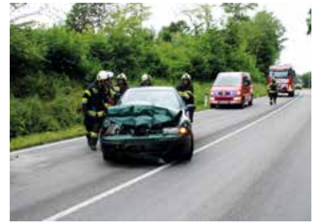
Auffahrunfall mit einem Verletzten B54 in Krukenal