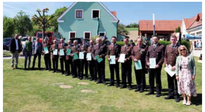
Überreichung Katastrophenhilfsmedaillen des Landes an verdiente Kameraden für mehrmaligen Unwettereinsatz