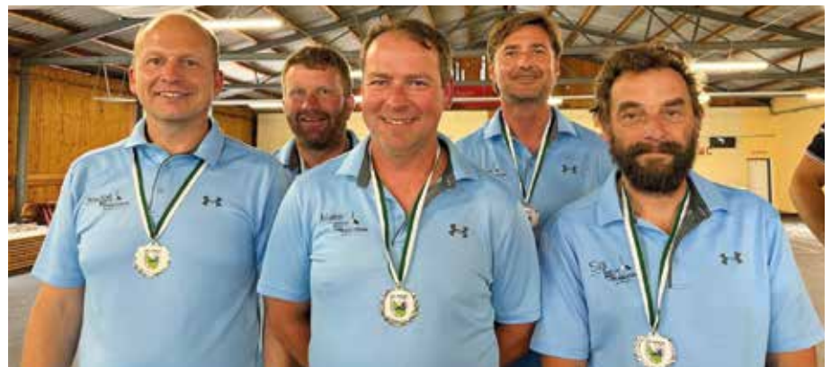
Die Mannschaft des ESV Hofkirchen bei der Gebietsliga 2026

Auch am zweiten Tag knüpfte die Mannschaft nahtlos an die starke Leistung an. Mit nur einer Niederlage – ausgerechnet gegen den erstplatzierten Gegner – sicherte sich das Team den hervorragenden zwei-