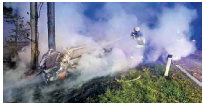
Verkehrsunfall an der B54 mit brennendem Fahrzeug