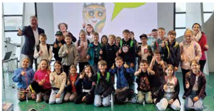
Die 3. und 4. Klasse d. VS Hofkirchen zu Besuch in der Bezirkshauptmannschaft