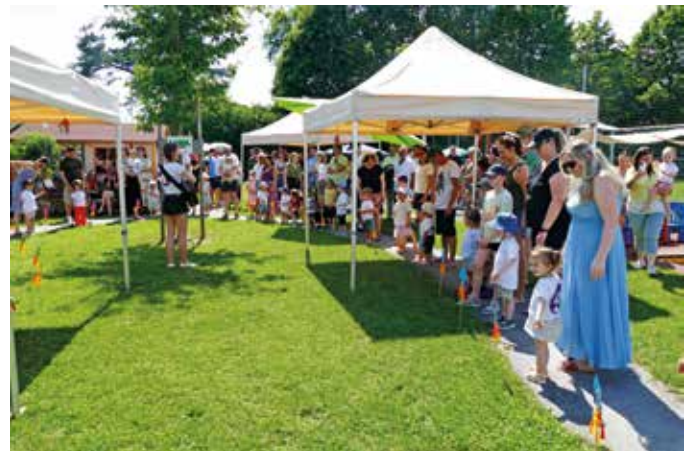
Die Krippenkinder mit ihren Familien beim Krippenkränzchen