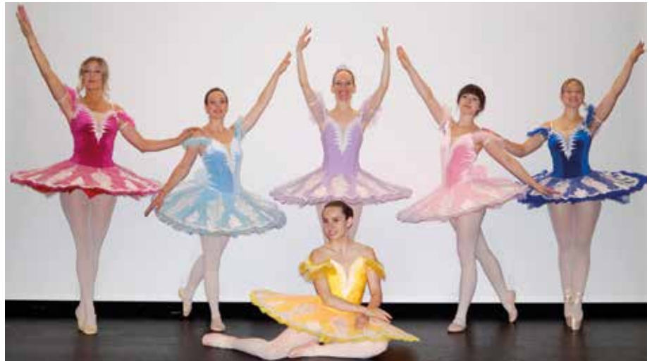
„Die Feen“-Dornröschen Aufführung